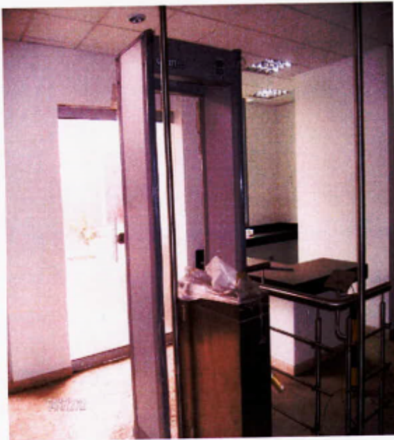
Puerta de ingreso