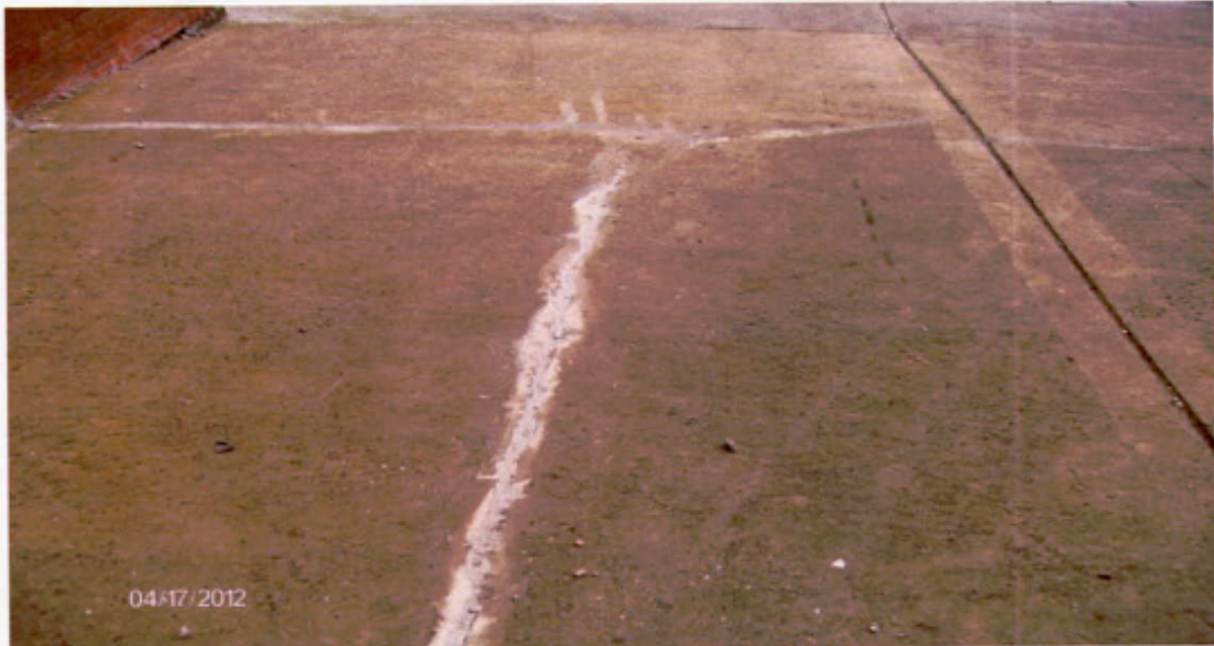
Zonas de acceso

"Por un control fiscal efectivo y transparente"