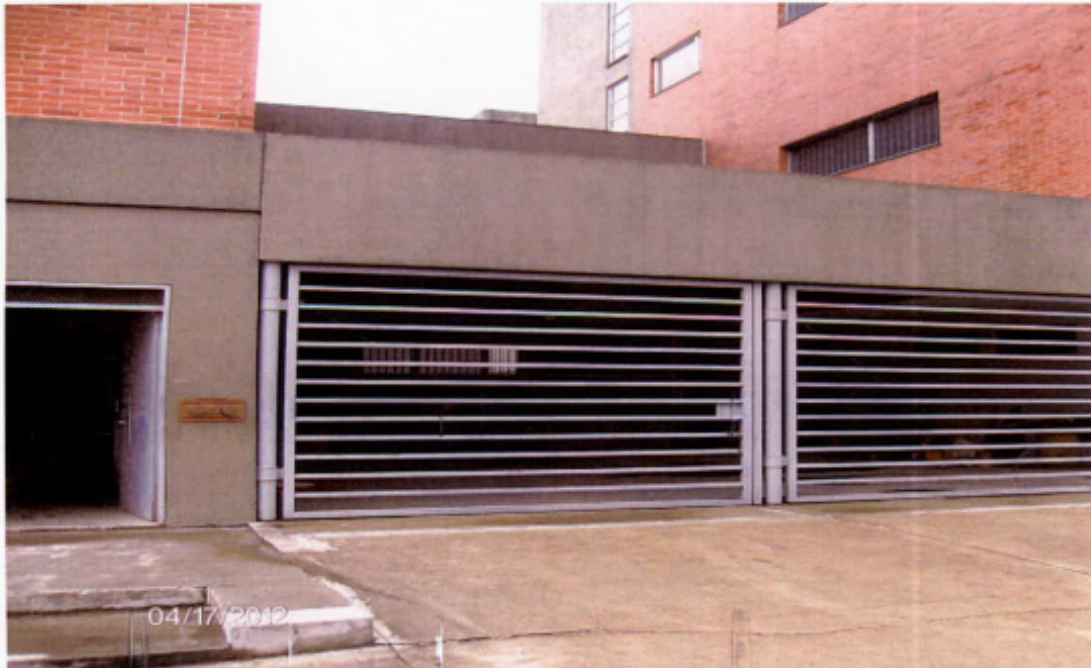
Zonas de acceso

Igualmente, es importante que su Despacho conozca que la obra construida para surtir el traslado de la UPJ Puente Aranda, sin que aún tenga el uso previsto, en la actualidad ya presenta deterioro progresivo como lo son fisuras sectorizadas en acabados de los pisos, agrietamiento de pavimento en zonas de acceso, conforme lo ilustran las siguientes imágenes: