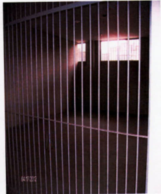
Salas de retenidos

Es importante tener en cuenta que al Distrito Capital los 2.892 metros cuadrados construidos le costaron $3.660 millones , lo que significa que canceló $1'205 millones por metro cuadrado, según los estudios de factibilidad realizados por el mismo FVS. De esta manera, la situación fáctica antes descrita pone de presente que la contratación suscrita para contar con