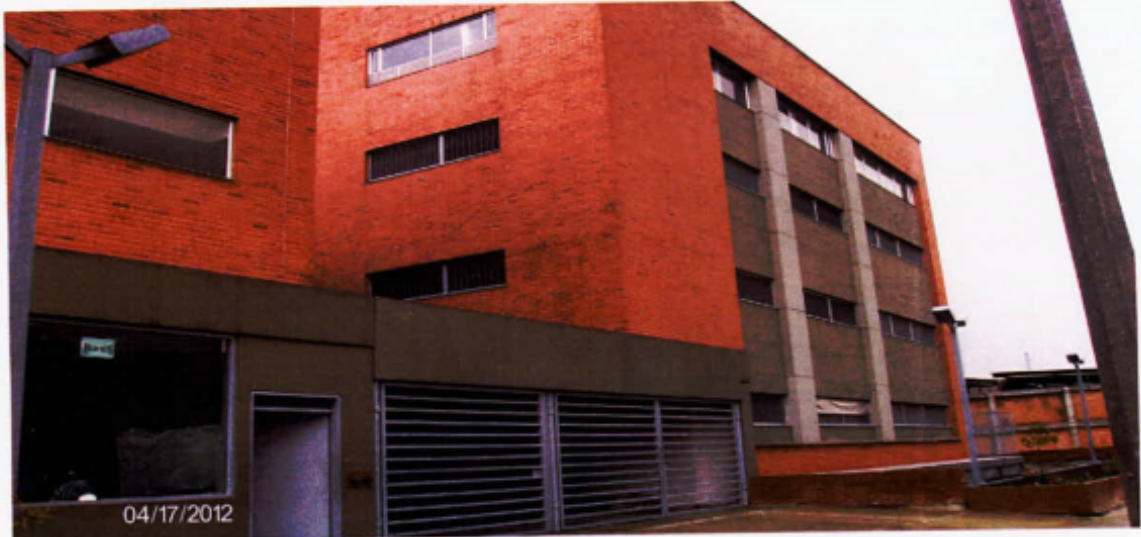
Inmueble para UPJ Puente Aranda recibido el 03/05/2010

"Por un control fiscal efectivo y transparente"